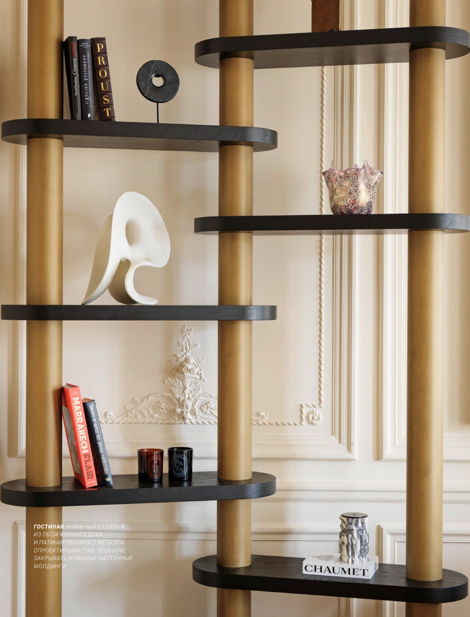
ГОСТИНАЯ. КНИЖНЫЙ СТЕЛЛАЖ ИЗ ОБОЖЖЕННОГО ДУБА И ПАТИНИРОВАННОГО МЕТАЛЛА СПРОЕКТИРОВАН ТАК, ЧТОБЫ НЕ ЗАКРЫВАТЬ ИЗЯЩНЫЕ НАСТЕННЫЕ МОЛДИНГИ